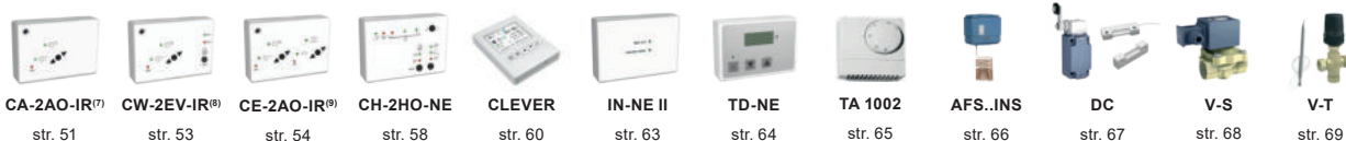
CA-2AO-IR (7) str. 51